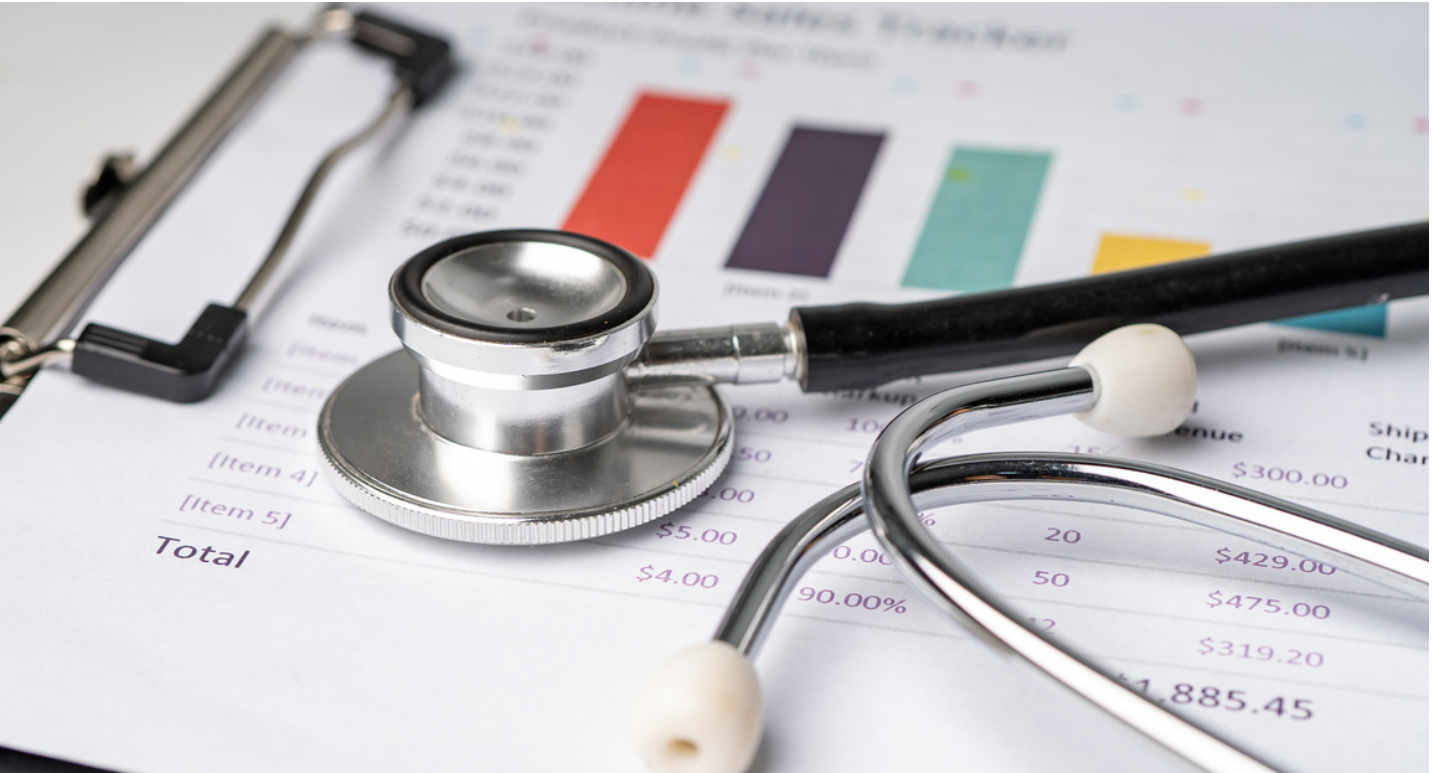
TABLEAU DE L'ORDRE 2024

Loi N°2004-019 du 30 septembre 2004 portant création de l'Ordre National des Médecins du Togo